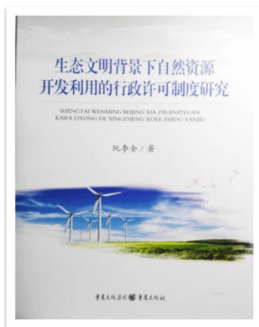
(图 4 《生态文明背景下自然资源开发利用的行政许可制度研究》 阮李全 著)

中心成员阮李全副教授，专著《生态文明背景下自然资源开发利用的行政许可制度研究》由重庆出版集团重庆出版社出版。