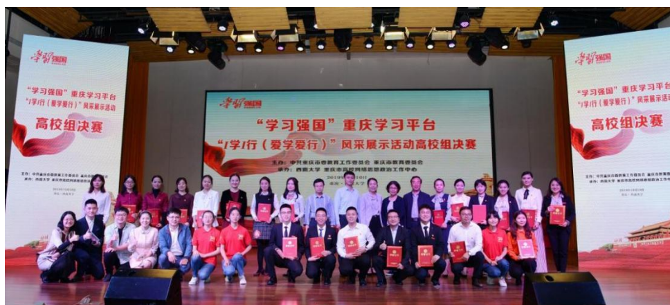
参赛选手和评委合影留念